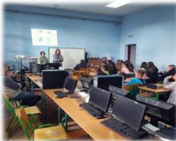
ОШ „Владислав Петковић Дис“