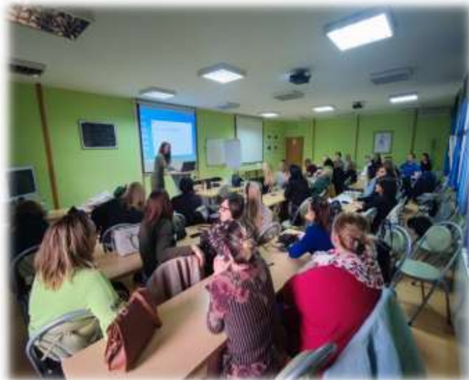
Центар за стручно усавршавање

Маскенбал је одржан у петак 31.3.2023. у Културном центру. Ово је традиционални, осми по реду маскенбал који организује наша школа. Сваке године учешће узимају сви ученици и запослени као и гости из различитих установа са територије Моравичког округа. Ове године учешће су узели: вртић „Сунце“, вртић „Мали капетан“, ОШ „Краљ Александар Први“ из Горњег Милановца, ОШ „Милан Благојевић“ из Лучана, ОШ „ Степа Степановић“ из Горње Горевнице истурено одељење у Миоковцима, ОШ „Бенерал Марко Ђ. Катанић“ из Бреснице, ОШ „Свети Сава“, Центар за пружање услуга социјалне заштите „Зрачак“.