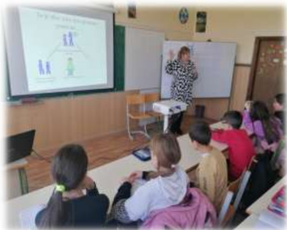
ОШ „Бранислав Петровић“